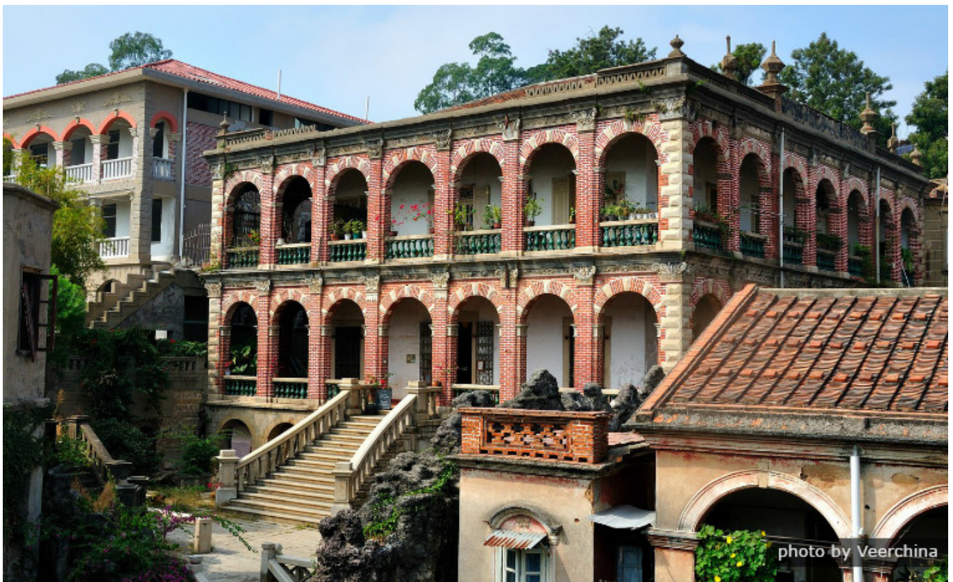
Le jardin Shuzhuang