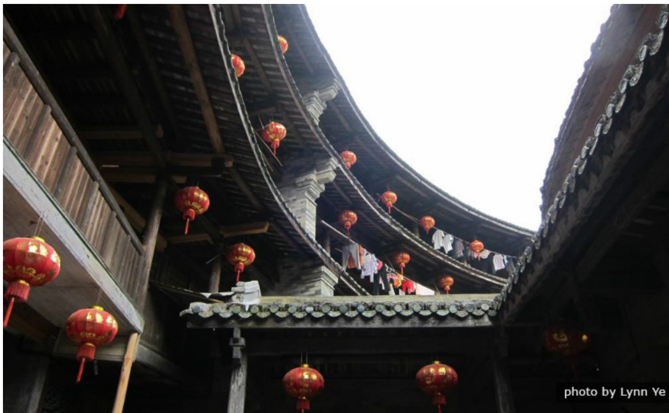
Hong Keng Tulou